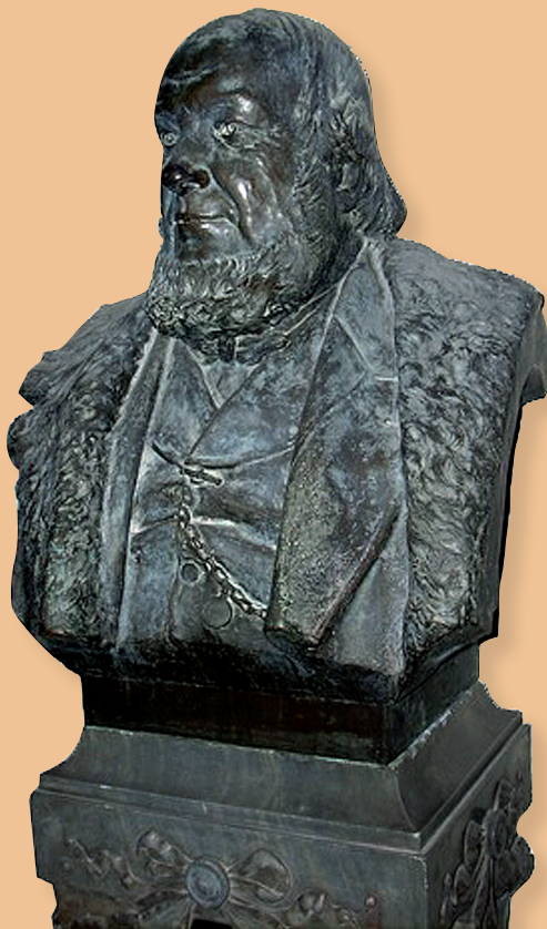
Een borstbeeld van Jacob Moleschott in de Università Sapienza in Rome. Het borstbeeld is een geschenk van de studenten aan de universiteit en Jacob Moleschott ter gelegenheid van zijn 25-jarig jubileum als hoogleraar in oktober 1892.

fijnheid van tact'. Het rumoer en hoongelach in de senaat ten spijt, Moleschott gaat onverstoorde door: 'Aan vrouwen vertrouwen wij de opvoeding toe onzer kinderen, het bestuur van het huis, het bewaren van onze eer. Dan kun je vrouwen het kiesrecht voor het gemeentehuis niet ontzeggen onder het motto: Gij kunt hier noch met eene gedachte, noch met eene stem binnentreden; gij zijt niet verstandig, niet beschaafd, niet voorzienig genoeg daarvoor.' Onder boegeroep en fluitconcerten voorspelt Moleschott dat vrouwen in de toekomst het recht op echtscheiding zullen verwerven. Hij eindigt zijn betoog met een voor die tijd bijzondere voorspelling: 'En wij zullen meer zien. Wij zullen zien dat die vrouwen, aan welke wij nu niets anders dan het kiesrecht willen toekennen, ook verkiesbaar zullen zijn. Zij zullen ook deel uitmaken van het parlement.'