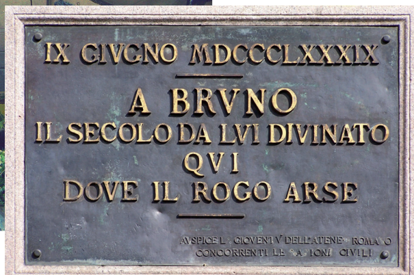
foto links: Campo de' Fiori in Rome. Op 9 juli 1889 wordt op feestelijke wijze het standbeeld van Giordano Bruno onthuld, op de plek waar hij in jaar 1600 verbrand werd. Jacob Moleschott is een van de initiators achter de totstandkoming van dit standbeeld. foto rechts: Gedenksteen, gewijd aan Bruno. In de loop van de negentiende eeuw groeit hij uit tot een icoon van de internationale vrijdenkersbeweging.

geziene man in 's-Hertogenbosch. Zo maakt hij gedurende lange tijd deel uit van de plaatselijke 'commissie van geneeskundig onderzoek en toezicht'. In die hoedanigheid levert hij regelmatig een bijdrage aan vaccinatiecampagnes tegen besmettelijke ziekten.